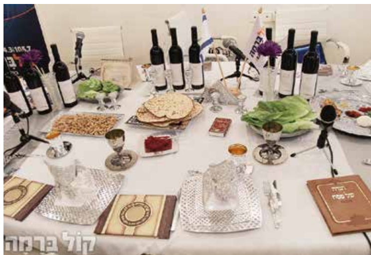
Ett dukat sederbord

Det är inte alltid lätt att veta vilka av dagens pesachtraditioner som existerade redan på Andra templets tid och vilka som tillkommit senare. I dagens påskmåltid brukar man ta tre osyrade bröd, מצות matsot, och så bryta det mittersta och lägga den delen i ett linkläde. Denna del av det osyrade brödet kallas afikoman . Ordet afikoman är grekiska och betyder ”han som kommer”. Om det är så att denna tradition med afikomanen fanns redan på Jesus tid, så var det just afikomanen Jesus tog när han sade: Detta är min kropp som blir utgiven för er. Gör detta för att minnas mig. (1 Kor 11:24)